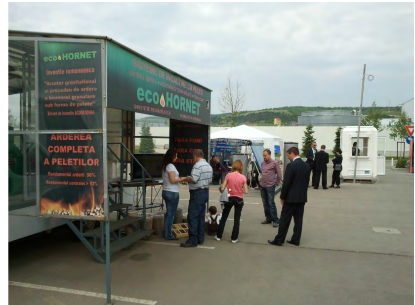
Ziua a doua targ - exterior