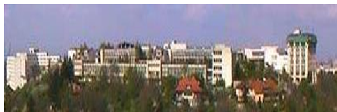
Universitatea Transilvania de Braşov