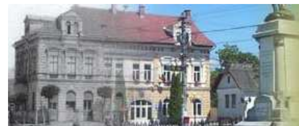
Primăria Municipiului Săcele